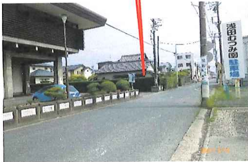
東側駐車場出入口